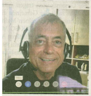
sieht der Patient seinen Haus- arzt auf dem Bildschirm.

...schwierigkeit. Eigentlich müssen ...Patienten auf der Internetseite der ...Praxis nur mit wenigen Klicks einen ...Termin buchen, erhalten dann per ...E-Mail einen Link, der fünf Minu- ...ten vor dem Videoanruf mit dem ...Arzt ins virtuelle Wartezimmer ...führt. Noch läuft die Technik aber